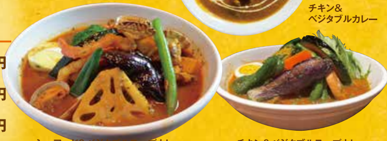
シーフード&ベジタブルスープカレー