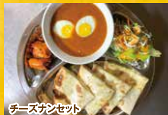
チーズナンセット